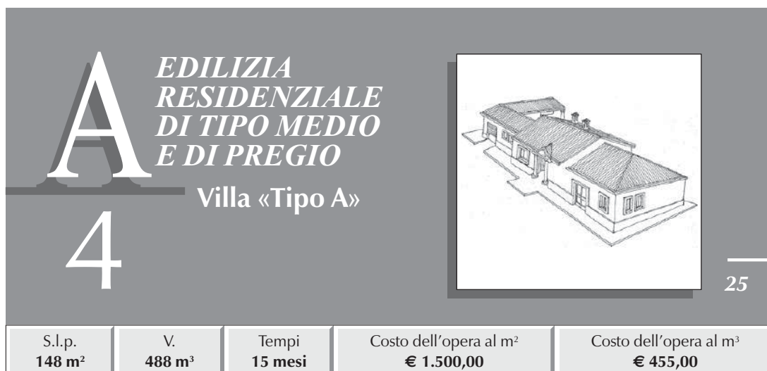
TABELLA RIASSUNTIVA DEI COSTI E PERCENTUALI D'INCIDENZA